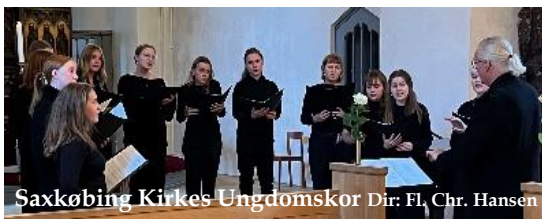
Saxkøbing Kirkes Ungdomskor Dir: Fl. Chr. Hansen

For tredje år i træk betyder Anemone-koncert de bedste musikere i Danmark inden for jazz, klassisk, folk og blandinger herimellem – og dertil et godt lokalt kor!